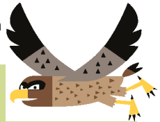
Sharief de bruine kiekendief

informatie over het opstellen van beheerovereenkomsten door de Vlaamse Landmaatschappij (VLM)