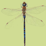
Libellen en waterjuffers