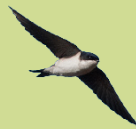
Huis- en boerenzwaluwen: modder voor de nestjes