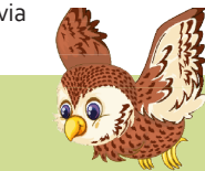
Stan de steenuil