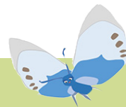
Vlada de vlinder