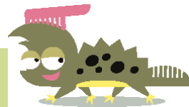
Kamiel de kamsalamander