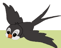
Zwita de zwaluw