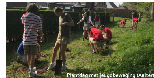
Plantdag met jeugdbeweging (Aalter)