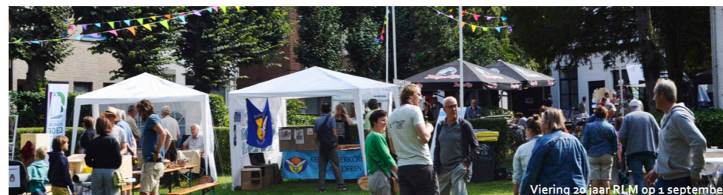
Viering 20 jaar RLM op 1 september

Op 13 december vond in het kader van de Warmste Week onze Warmste Quiz van het Meetjesland plaats. Met ongeveer 30 ploegen, was het een erg succesvol evenement.