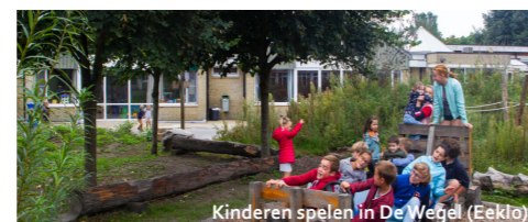
Kinderen spelen in De Wegel (Eeklo)

We werkten mee aan de aanleg van 8 nieuwe speel- en leerruimten in het Meetjesland, waarvan 5 op scholen.