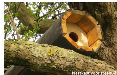
Nestkast voor steenuil

We verdeelden 180 nestkasten en kunstnesten en leverden ook 6 bijenhôtels. Daarnaast werd er in totaal 1,5 ha aan akkers en bermen ingezaaid met biodiversiteitsmengsels.