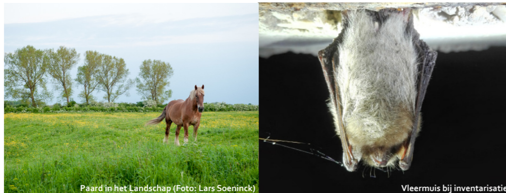
Paard in het Landschap

JAARVERSLAG 2019 REGIONAAL LANDSCHAP MEETJESLAND