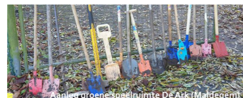
Aanleg groene speelruimte De Ark (Maldegem)

In 2019 organiseerden we 10 educatieve activiteiten, met in totaal 330 deelnemers. We bieden een brede waaier aan vormingen aan. De eerste van 2019 was een cursus knotten van bomen en hakhoutbeheer.