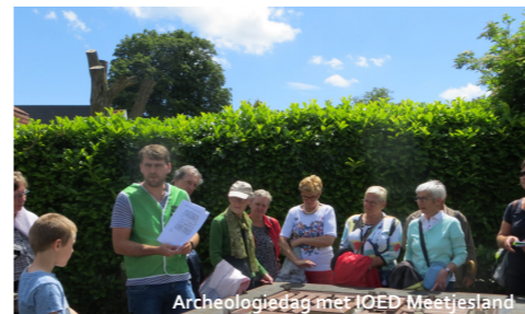
Archeologiedag met IOED Meetjesland