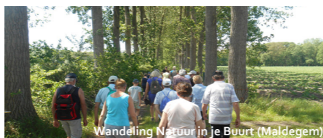
Wandeling Natuur in je Buurt (Maldegem)

In 2019 (her)openden we samen met de gemeentebesturen 1,22 km trage wegen en werd er 1,25 km wandelpad heringericht.