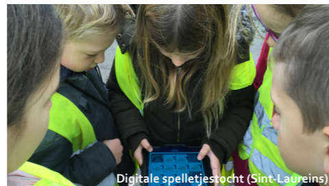
Digitale spelletjestocht (Sint-Laureins)