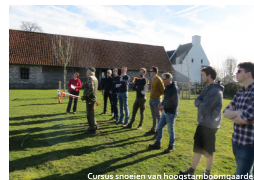
Cursus snoeien van hoogstamboomgaarden