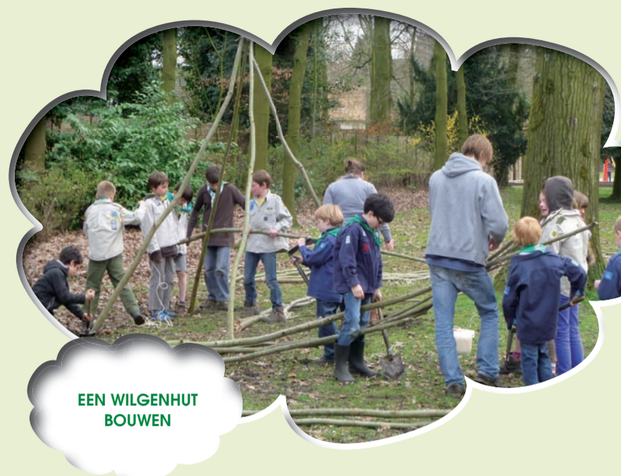
EEN WILGENHUT BOUWEN

De gemeente zorgt voor de verdere verwezenlijking van het project. Zo komen er twee amfitheatres en worden nog bomen bij geplant voor het speelbos. Als die werken gebeurd zijn zal ons terrein er super slijk bij liggen! Zo wordt de droom van de KLJ, het speelplein en zelfs ook de buurtbewoners gerealiseerd: een plek waar iedereen graag, veilig en avontuurlijk kan spelen!