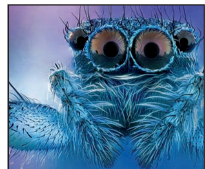
...maar ook heel mooi!