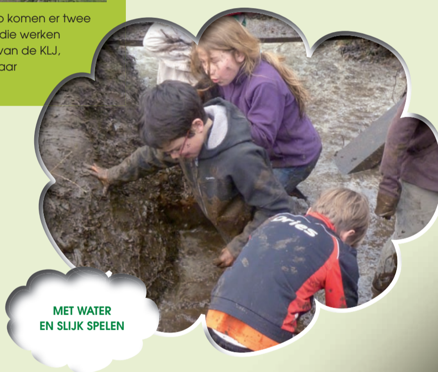
MET WATER EN SLIJK SPELEN