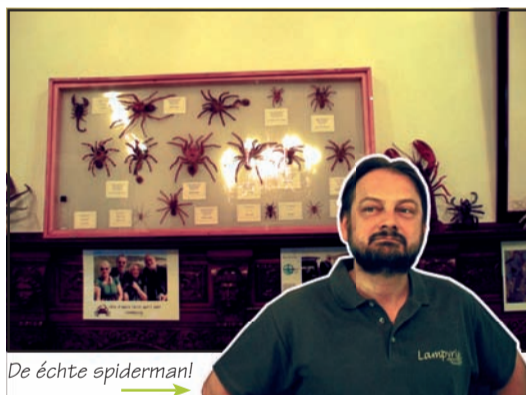
De échte spiderman!