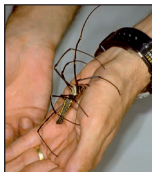
Niet voor watjes...