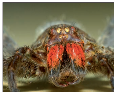
Een beetje griezelig...