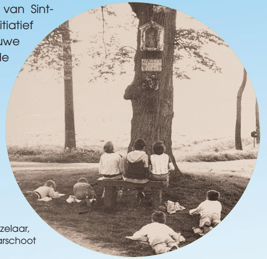
kruispunt Meistraat-Wittevoer, Waarschoot