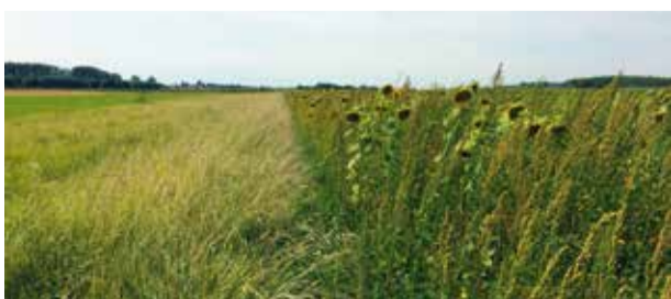
Het Partridge-bloemenmengsel (rechts) in combinatie met een beheerovereenkomst gemengde grasstrook plus (links).

Een geschikte habitat voor akkervogels voldoet aan de zogenaamde 'grote drie': voldoende zomervoedsel (insectenrijke zones), voldoende wintervoedsel (zadenrijke zones) en voldoende nestgelegenheid en dekking. Enerzijds worden met lokale landbouwers bestaande akkervogelbeheerovereenkomsten afgesloten bij de VLM en anderzijds worden enkele experimentele beheermaatregelen uitgetest.