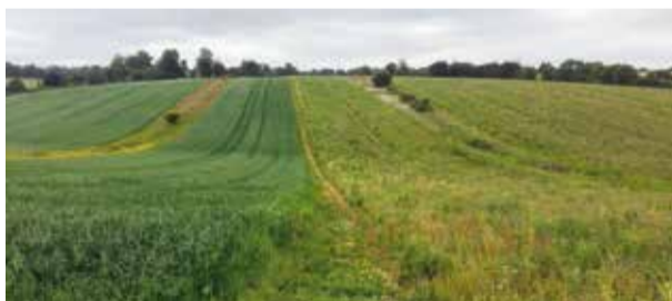
Twee keverbanken in het glooiende landschap van één van de Engelse voorbeeldgebieden in Rotherfield.

De tweede experimentele maatregel bestaat uit het aanleggen van keverbanken of 'beetle banks'.