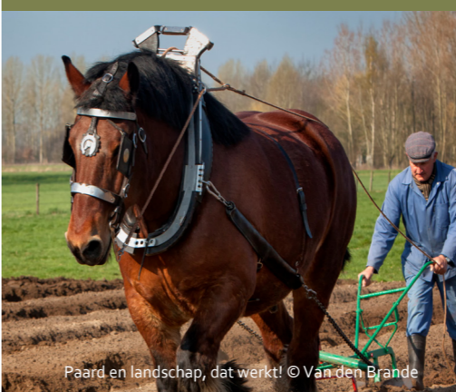
Paard en landschap, dat werkt!

De toename van het aantal paardenhouders biedt heel wat kansen voor biodiversiteit, ecologisch herstel en vrijwaring van waardevolle landschappen. Door streekeigen kleine landschapselementen te integreren, paardenweides als kruidenrijke graslanden te beheren en landschapsvriendelijke materialen te gebruiken, bent u naast paardenhouder, ook landschapsbouwer!