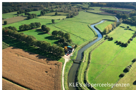
KLE's als perceelsgrenzen

In Vlaanderen vind je verschillende streken. Bij elke streek hoort een landschapstype. Zo vind je boscomplexen, valleigebeden, open-, halfopen- en gesloten landschappen. Elk van deze landschapstypes is opgebouwd uit specifieke kleine landschapselementen (KLE's) zoals autochtone bomen, houtkanten, heggen, poelen, weiden en graslanden. Vroeger werden deze elementen gebruikt als perceelscheidingen, bron van gerief- of brandhout, oriëntatiepunten, veekering, extra schaduw en watervoorziening, maar ook vandaag bewijzen zij hun nut.