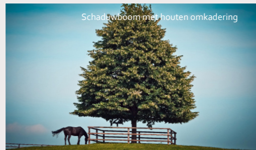
Schaduwboom met houten omkadering

-Door schaduwbomen, knotbomen, houtkanten en heggen te integreren zorg je voor beschutting tegen zon, regen en wind, geef je structuur aan het landschap en bezorg je andere faunasoorten voedsel- en schuilmogelijkheden.