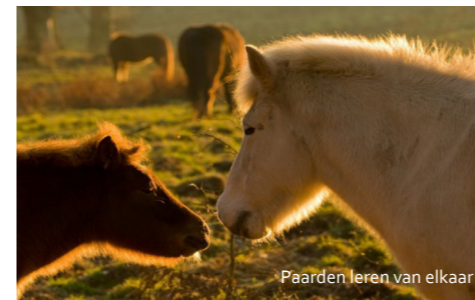
Paarden leren van elkaar

Paarden zijn kuddedieren die nood hebben aan gezelschap, beweging, voedsel en water. De weide is dé plaats bij uitstek waar paarden zich "thuis" voelen. Het is de natuurlijk biotoop van het gedomesticeerde paard. Paarden geven zelfs de voorkeur aan de relatieve vrijheid op de weide boven, het op het eerste zicht, hogere comfort in een stal of schuilhok.