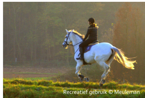
Recreatief gebruik

en het opduiken van schuilhokken, rijpistes, ruitersporen, maneges, jumpingconstructies, lichtbakken en afrasteringen. Het veranderd landgebruik en het beheer van grasweiden heeft bovendien een niet te onderschatten impact op de biodiversiteit, de waterhuishouding en de groenstructuren van Vlaanderen. Het is dan ook cruciaal deze landschappelijke transformatie op een verantwoorde manier in te passen binnen onze steeds schaarser wordende open ruimte.