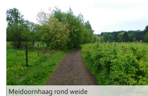
Meidoornhaag rond weide