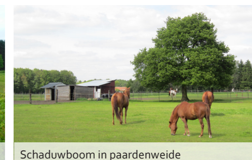
Schaduwboom in paardenweide