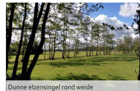
Dunne elzensingel rond weide