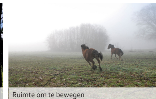
Ruimte om te bewegen