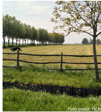
Landelijke cuesta rug

De Mariagrot van Kleit ligt niet op de route maar is een ommetje waard. Je vindt de grot tussen wandelknooppunt 42 en 43.