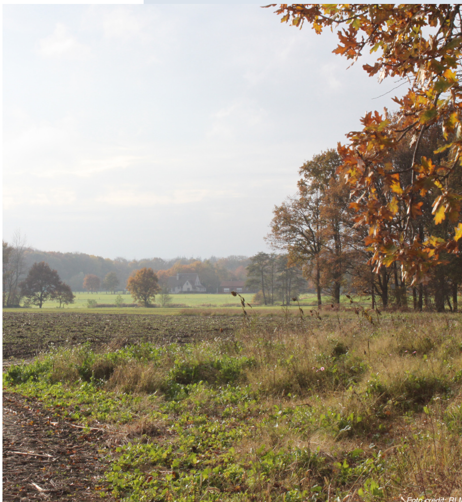
Uitzicht langs de cuesta rug

Later werden nog een aantal kapelletjes en beeldengroepen bijgebouwd. In 2004 werd de grot met omgeving geklasseerd als monument.