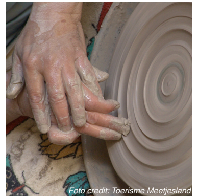
Foto credit: Toerisme Meetjesland Keramiekatelier, Drongengoedhoeve