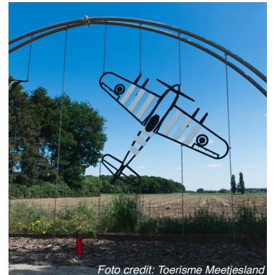
Monument oud vliegveld Ursel