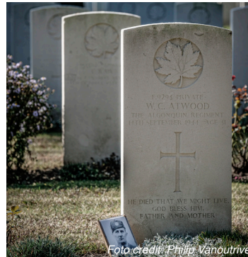
Adegem Canadian War cemetery

De stoomtreinroute is een veelzijdige route die je toelaat om de beleving van het open landbouwlandschap te combineren met enkele historische stops.