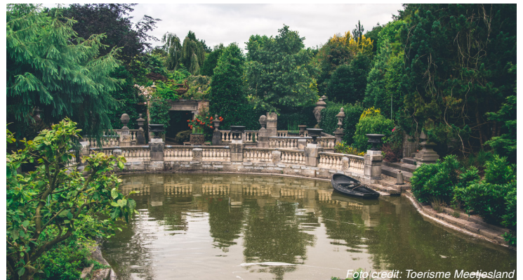
Tuinen van Adegem