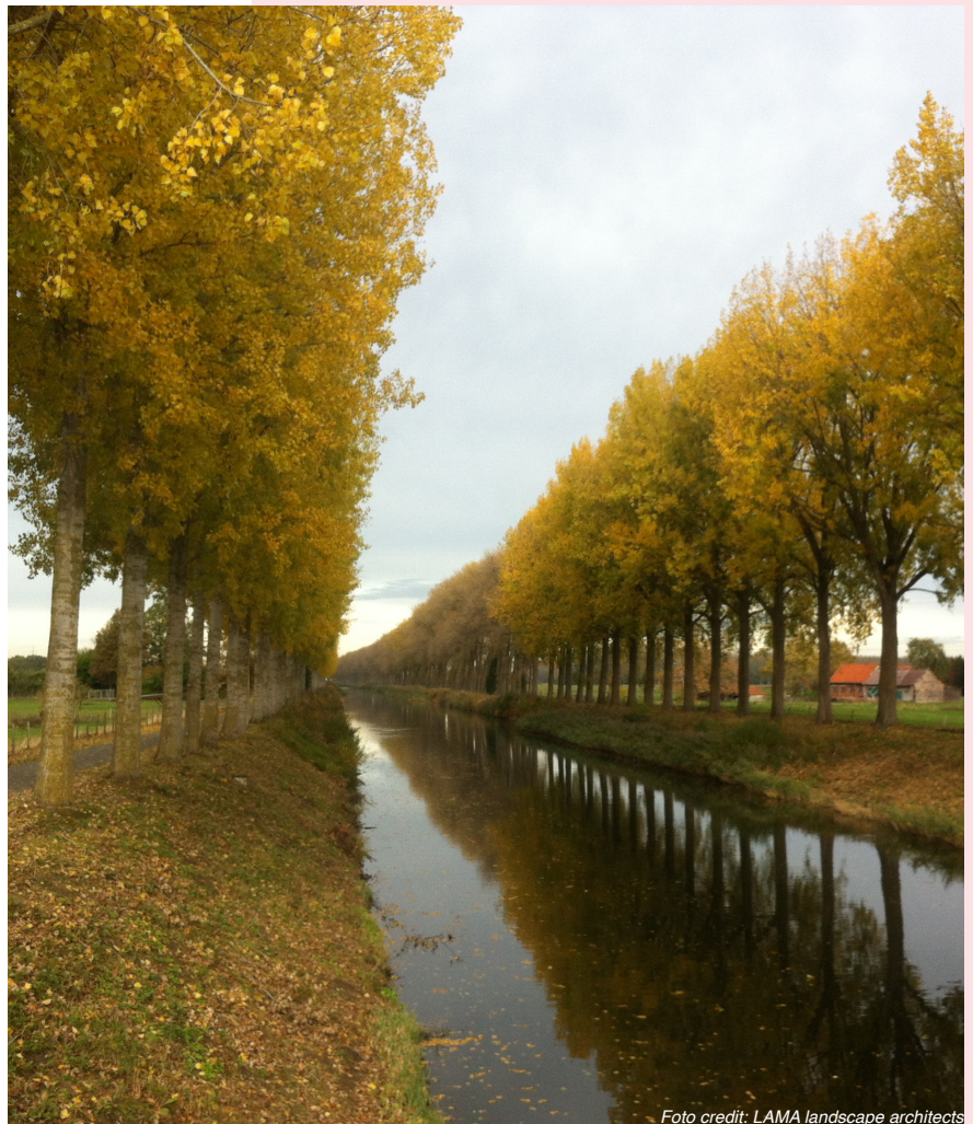
Schipdonkkanaal in de herfst

De route buigt af in Strobrugge, waar het Schipdonkkanaal en het Leopoldskanaal, de "Blinker", bij elkaar komen en broederlijk naast elkaar lopen tot aan de zee. Beide waterwegen worden van het land en elkaar gescheiden door een stevige dijk, die omzoomd is met statige populieren.