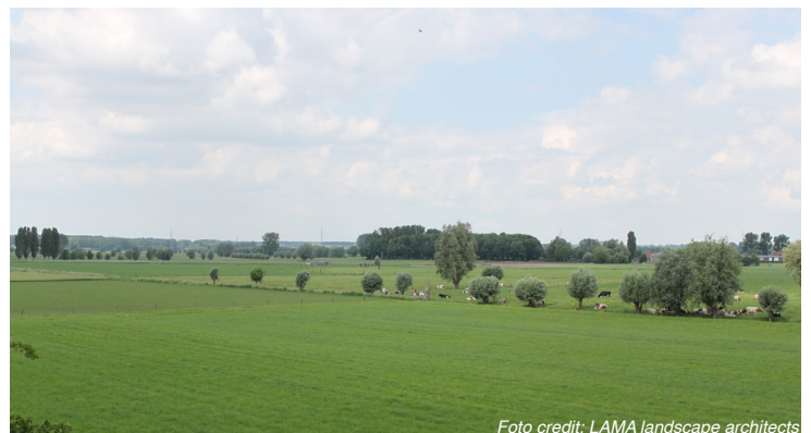
Uitzicht op het cuestafront